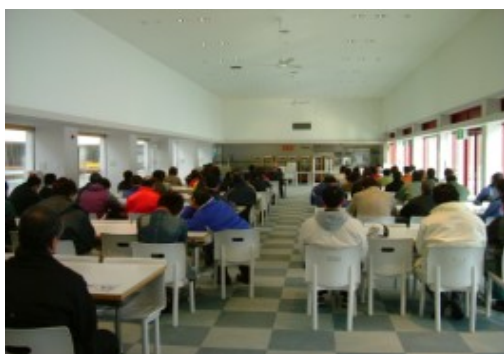
営業前の安全教育